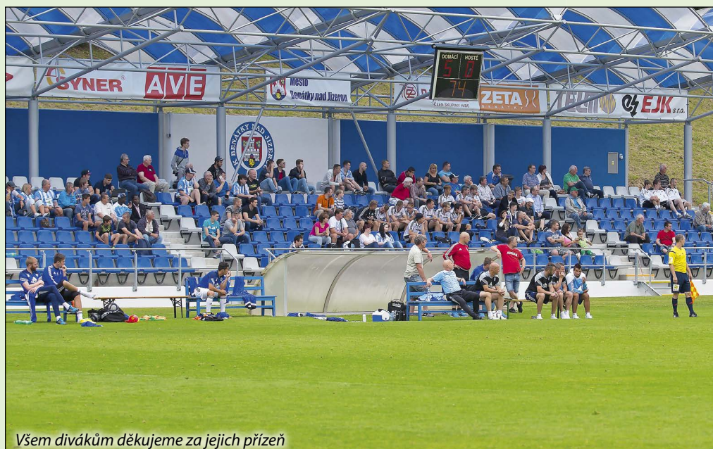
Všem divákům děkujeme za jejich přízeň