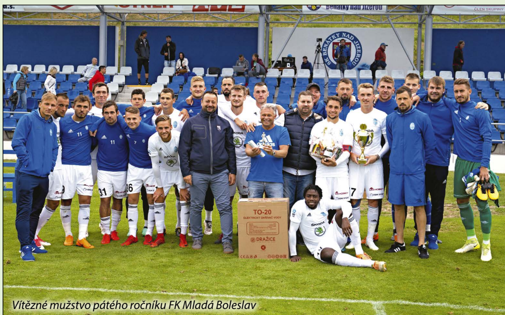
Vítězné mužstvo pátého ročníku FK Mladá Boleslav