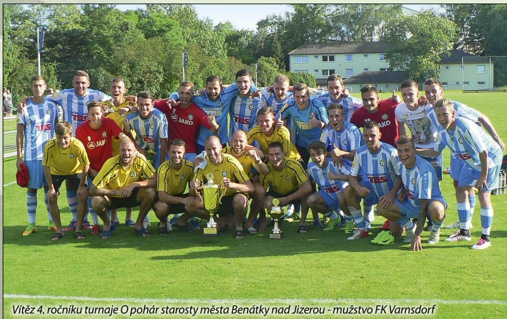
Vítěz 4. ročníku turnaje O pohár starosty města Benátky nad Jizerou - mužstvo FK Varnsdorf

Jménem fotbalového klubu Vás srdečně vítám na čtvrtém ročníku turnaje. Jsme rádi, že si na předchozí ročníky turnaje našlo cestu početné množství příznivců fotbalu z širokého okolí. Velké díky za uskutečnění tohoto turnaje patří vedení FK Mladá Boleslav, bez jehož pomoci bychom těžko přilákali do našeho města čtyři kvalitní mužstva. V letošním roce k nám jako nováček turnaje přijede druholigový FK Varnsdorf, jehož hráče a funkcionáře u nás srdečně vítáme. Konání tohoto turnaje je součástí letité úspěšné spolupráce fotbalových klubů Boleslavi a Benátek. Bez hráčů, již prošli mládežnickou základnou v Boleslavi, kterých je v součas-