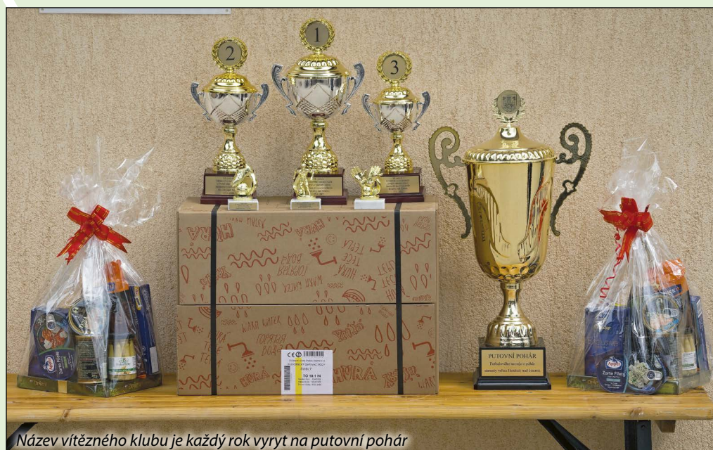
Název vítězného klubu je každý rok vyryt na putovní pohár