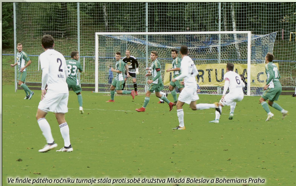
Ve finále pátého ročníku turnaje stála proti sobě družstva Mladá Boleslav a Bohemians Praha