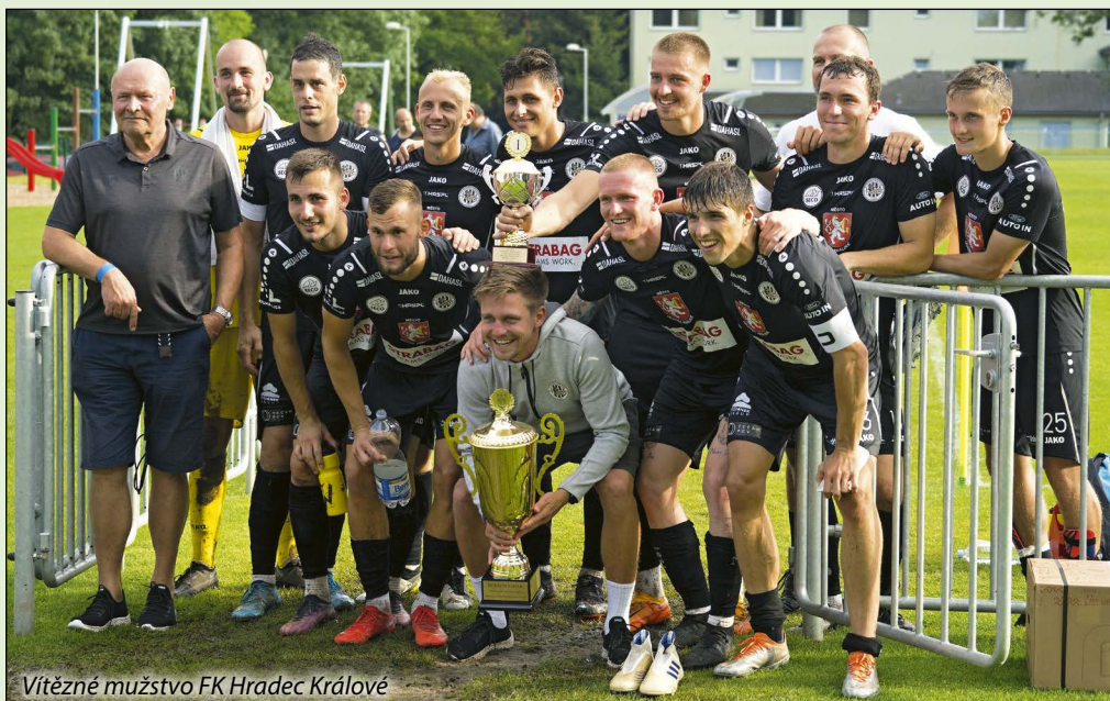
Vítězné mužstvo FK Hradec Králové

Dlouholetý prvoligový účastník 1. FK Příbram má za sebou sezónu o patro níž, se kterou ale U Litavky nemohla panovat vůbec žádná spokojenost. Málokdo předpokládal, že příbramští hráči budou hrát dokonce o druholigovou záchranu! Pod vedením dvou bývalých českých reprezentantů Tomáše Zápotočného a Marka Nikla se nakonec příbramským hráčům podařilo zachovat druholigovou příslušnost,